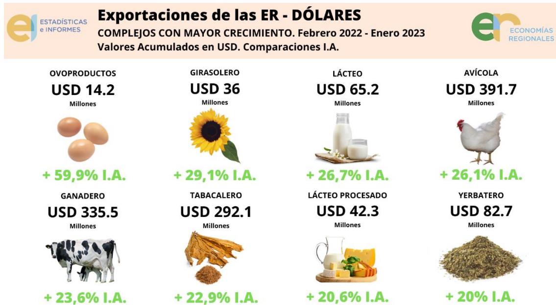
Gráfico 3: Monitor de Exportaciones de las Economías Regionales: los 8 complejos productivos de Argentina que más crecieron en dólares .

Por otra parte, se destaca el complejo vitivinícola , el de mayor incidencia en las exportaciones en dólares (15,6%), al presentar una caída del 2,8% .