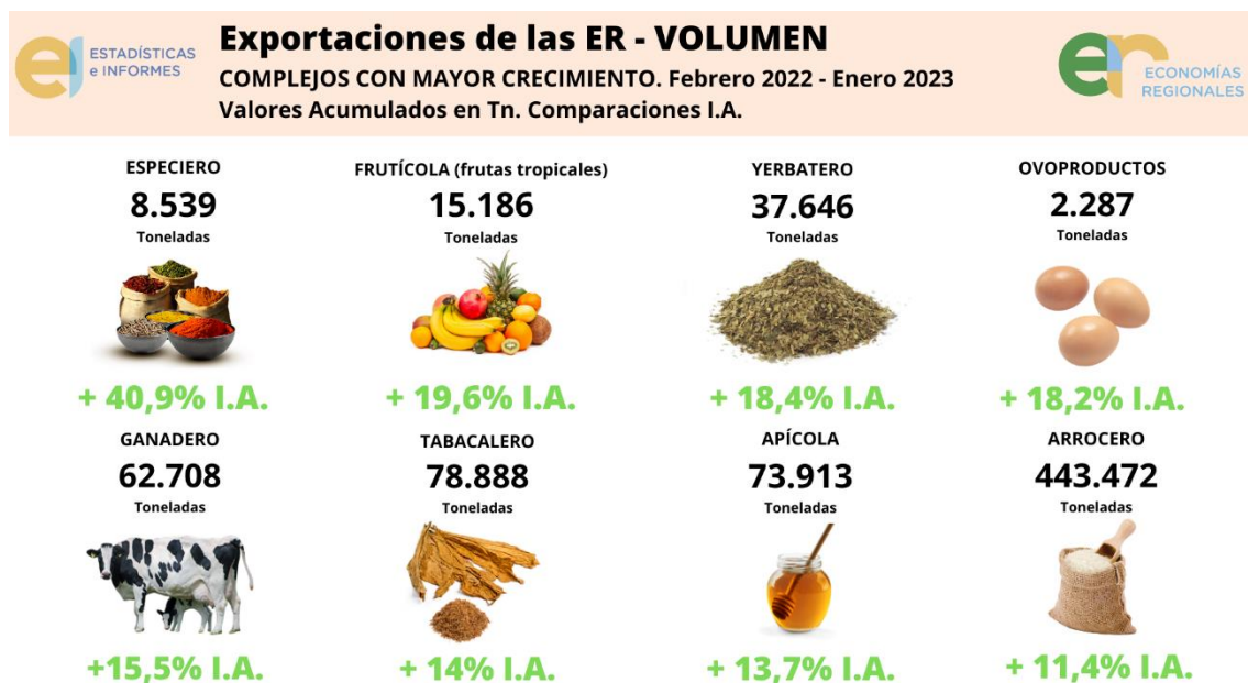
Gráfico 4: Monitor de Exportaciones de las Economías Regionales: los 8 complejos productivos de Argentina que más crecieron en volumen .

Son los casos del complejo cítrica , con una caída del 13,4%, el complejo maicero , con 13,4% y finalmente, el complejo vitivinícola , el cual redujo su volumen de exportación en un 16,5%