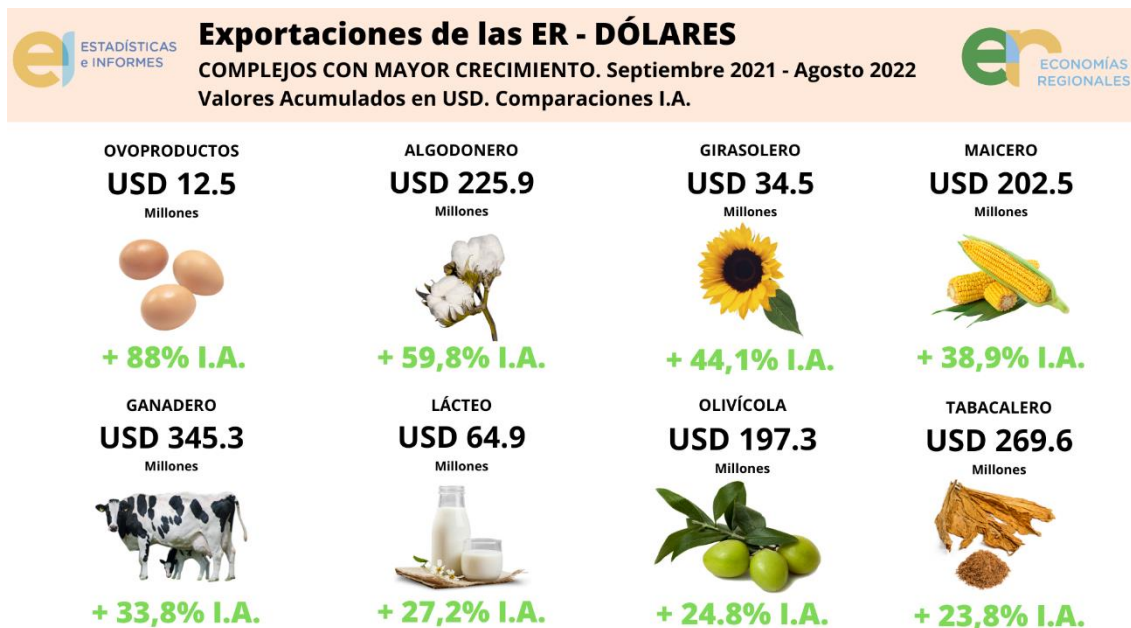
Gráfico 3: Monitor de Exportaciones de las Economías Regionales: los 8 complejos productivos de Argentina que más crecieron en dólares .

considerados en el monitor sólo participan del 2% del total exportado por este complejo.