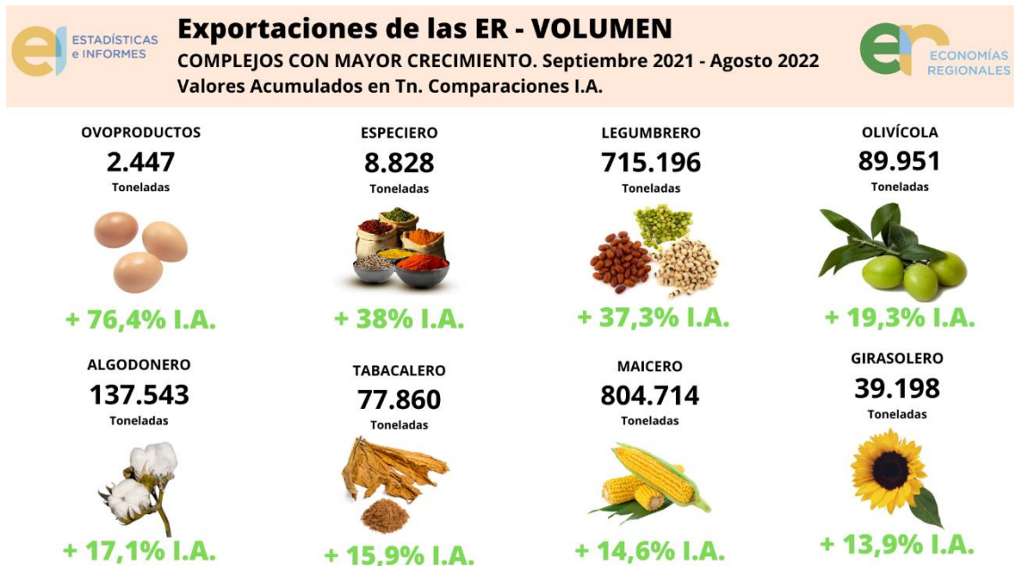
Gráfico 4: Monitor de Exportaciones de las Economías Regionales: los 8 complejos productivos de Argentina que más crecieron en volumen .

Complejo Olivícola: Muestra un crecimiento del 19,3% en el período analizado, alcanzando las 89.951 toneladas exportadas.