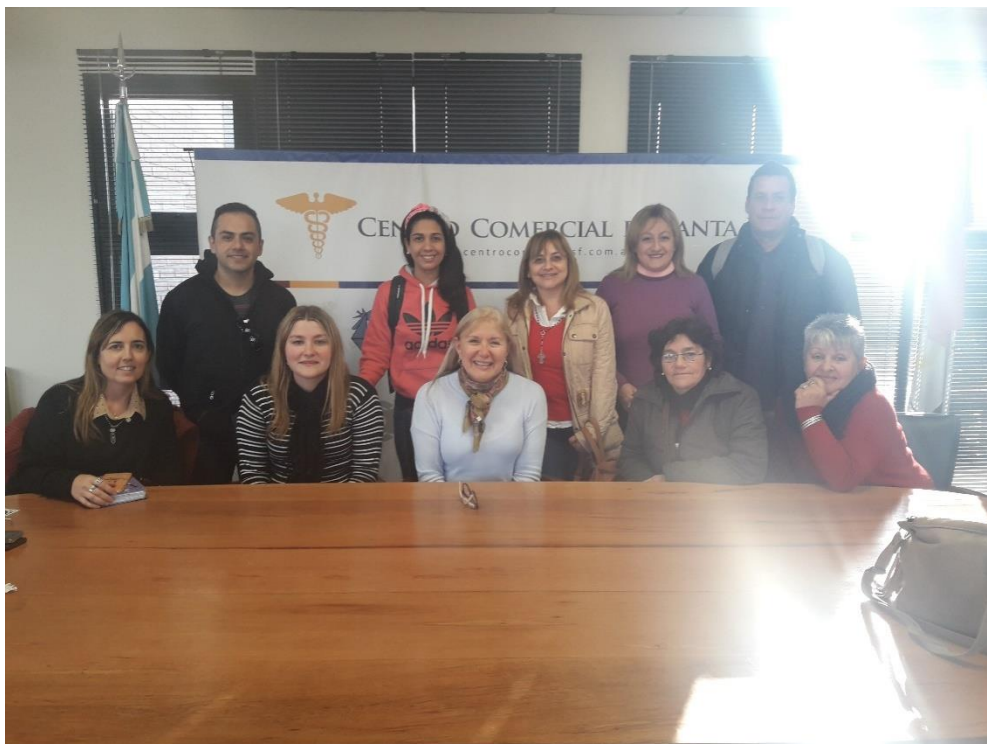
Coordinación para asistir al Primer Congreso Regional Mujeres Empresarias "Economía Negocios y finanzas"

Viernes 3 de agosto: La comisión de Mujeres del Centro Comercial de Santa Fe (CCSF) participó de la inauguración de las nuevas aulas donde se dictan las capacitaciones de alfabetización digital-Programa POETA (Programa de Oportunidades Económicas a través de la tecnología en las Américas)-CILSA-. Cabe destacar que en el programa POETA se capacitan las emprendedoras socias de la institución.