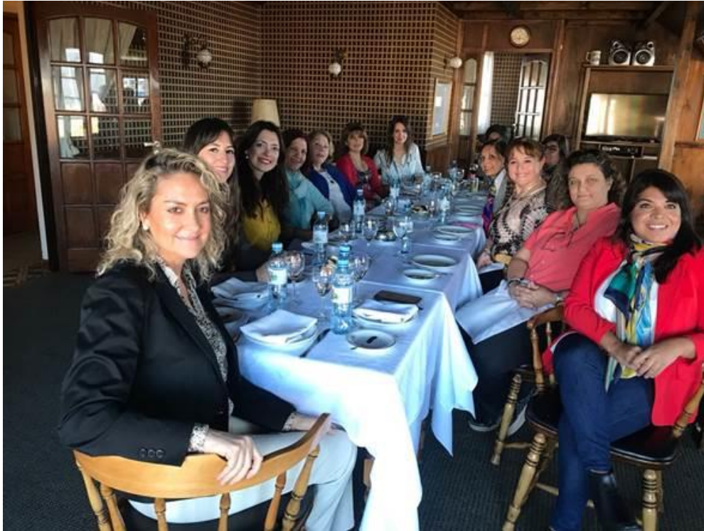
Reunión de mujeres empresarias en el almuerzo de camaradería

Jueves 2 de agosto: Se participó y se tuvo presencia institucional en el Encuentro de Mujeres LATAM "Potenciando el empoderamiento" organizado por WorkTec, en el Sheraton Libertador de la Ciudad de Buenos Aires.