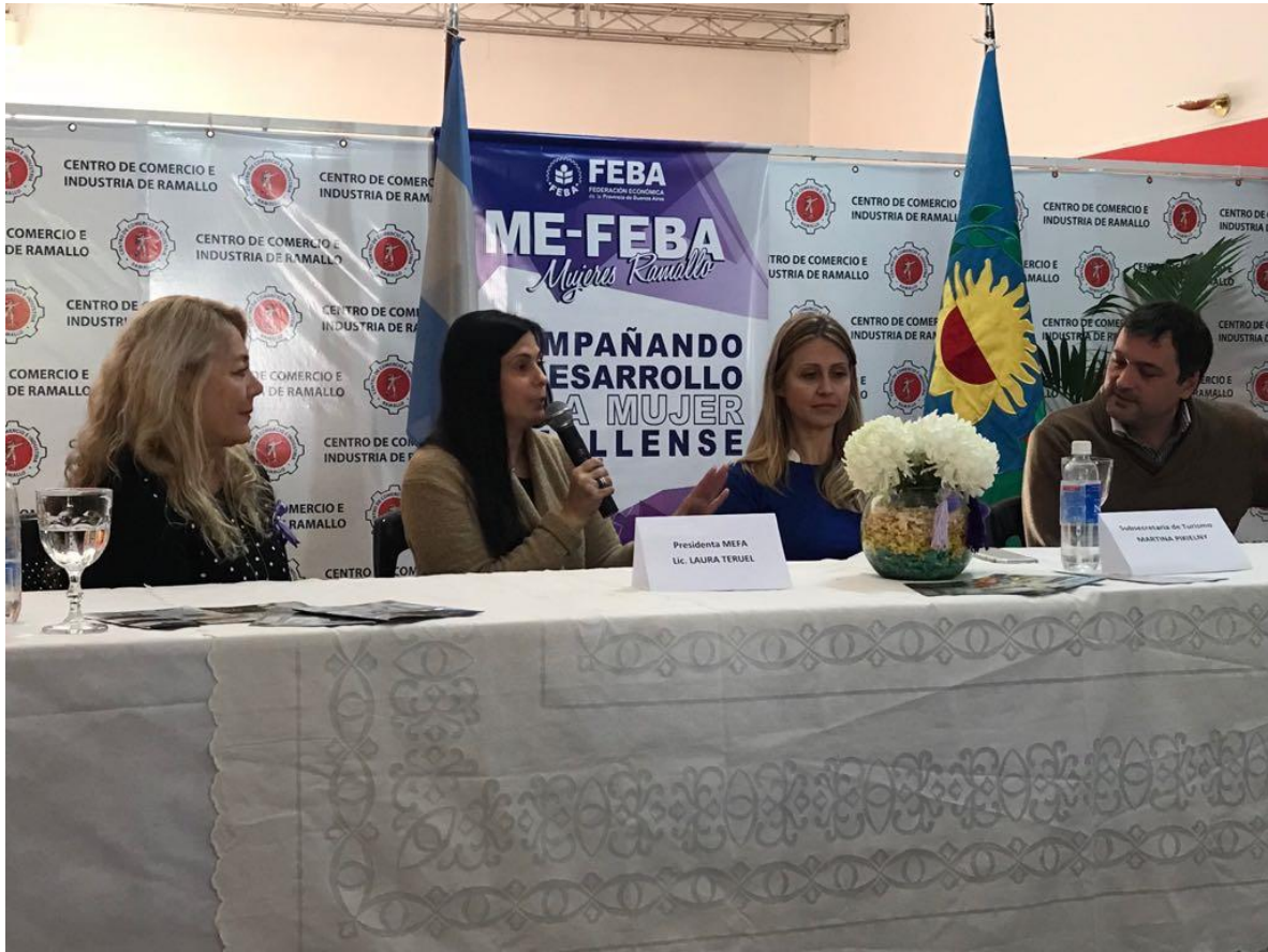
1° Jornada "La Mujer en la actividad económica actual. El turismo como eje transversal en la actividad económica"